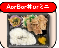
塩からあげ (4個入り) 580円