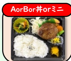
ソースハンバーグ 630円