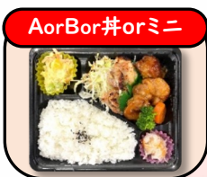
チキンステーキ 580円