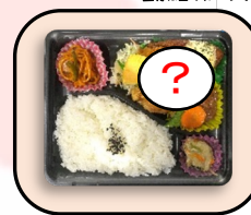
バラエティ 肉・魚・野菜などが入った 日替わり風メニュー 580円