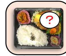
バラエティ 肉・魚・野菜などが入った 日替わり風メニュー 580円