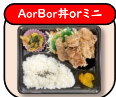
塩からあげ (4個入り) 580円